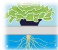
Food safety and hydroponic growing go hand in hand.